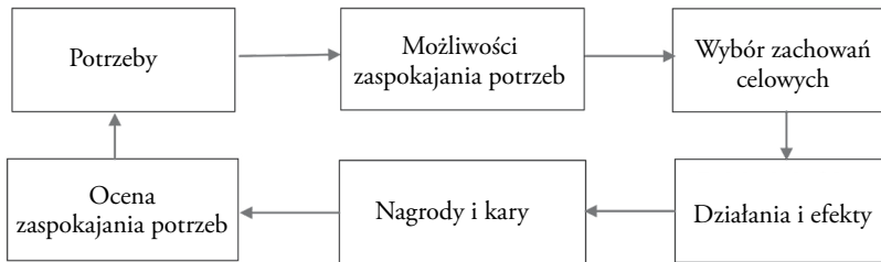
Rys. 1. Elementy procesu motywacji